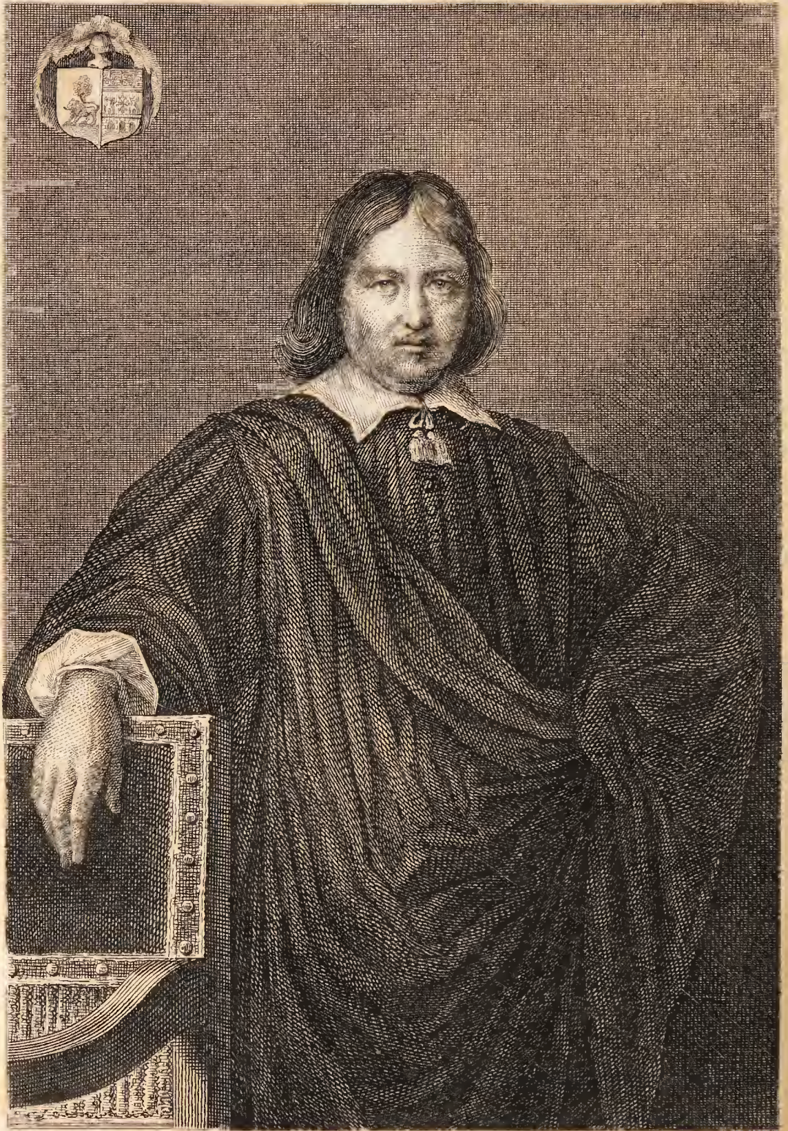
Couché fils dir.